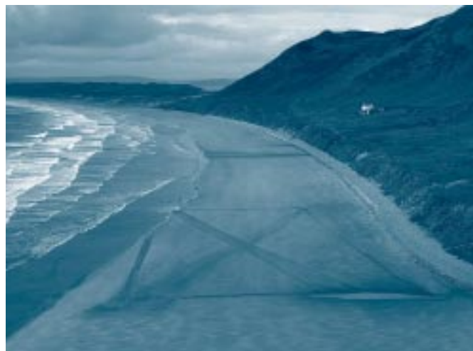
Aeth y Comisiwn ati i gynnal gweithgareddau hyrwyddo ledled Cymru. Traeth Rhosili, Gwyr, 30 Ebrill 2003.

1.29 Mae'r Comisiwn yn medru argymhell a rhannu cyfarwyddyd ar arfer gorau i Swyddogion Canlyniadau a gweinyddwyr etholiadol a bydd yn gwneud hynny pan fydd yn berthnasol.