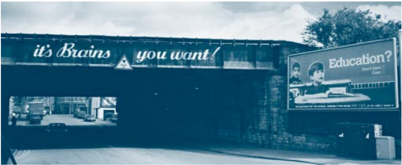
Parhaodd ymgyrch ymwybyddiaeth y Comisiwn trwy gydol y cyfnod hyd at y diwrnod pleidleisio.

4.60 Rydym hefyd wedi sefydlu Cronfa Mentrau Newydd i ddarparu cefnogaeth ariannol ar gyfer prosiectau newydd sydd wedi'u hanelu at godi ymwybyddiaeth a dealltwriaeth y cyhoedd. Rydym yn awyddus i annog ceisiadau am rantiau prosiectau oddi wrth sefydliadau o bob maint ac mae nifer bychan o brosiectau eisoes ar y gweill yng Nghymru o ganlyniad i'n nawdd grant. Er enghraifft, mae gan Gyngor Addysg mewn Dinasyddiaeth y Byd Cymru, Clybiau'r Bechgyn a'r Merched, Cymdeithas Pobl Fyddar Prydain a Chymdeithas Hansard 'Aelodau y Cynulliad mewn Ysgolion' i gyd brosiectau newydd ar y gweill.