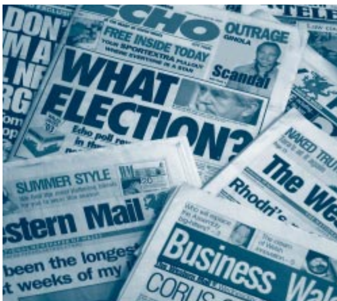
Y sylw yn y papurau Cymreig i etholiad Cynulliad Cenedlaethol Cymru.

Tynnwyd sylw at bwysigrwydd darparu gwybodaeth yn yr adroddiad hwn drosodd a throsodd. Mae'r bennod hon yn archwilio'r materion yn fwy manwl, gan edrych yn arbennig ar ddylanwad y cyfryngau – ffynhonnell wybodaeth allweddol ar gyfer y cyhoedd – ac ymgyrch ymwybyddiaeth y Comisiwn ei hun. Mae ein dadansoddiad yn defnyddio ymchwil annibynnol ar rôl y cyfryngau yn yr etholiad, sy'n cynrychioli'r arolwg mwyaf cynhwysfawr o sylw'r etholiad a wnaed hyd yma yng Nghymru.